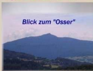
Blick zum "Osser"

Typ A1: 1 Schlafzimmer Typ A2: 2 Schlafzimmer